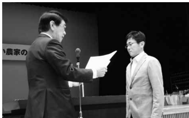
小麦の部 最優秀賞