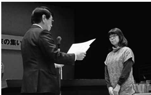
スイートコーンの部 最優秀賞