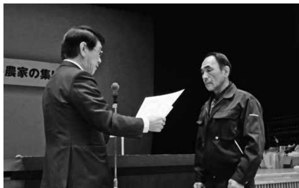
水稻5カ年の部 最優秀賞

組合員の皆様にはお忙しい中、農家の集いにご出席いただきありがとうございます。また、関係機関の皆様には於かれましても、ご出席と多大なるご理解ご協力を賜り、誠にありがとうございます。